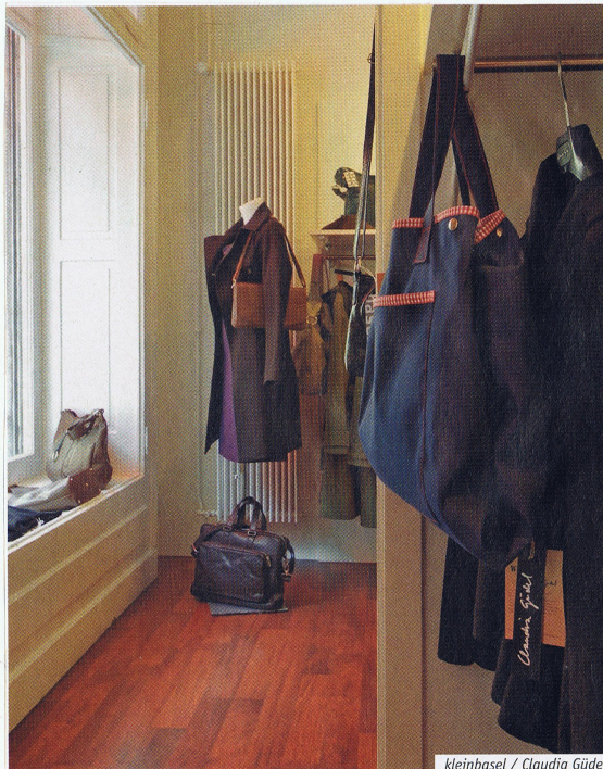
kleinbasel / Claudia Güdel