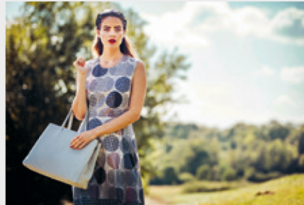
Ein Beispiel aus der Sommerkollektion 2016 von Tanja Klein.

frisch. Es gibt tolle Stoffmuster mit Punkten. Wie immer ist die Kollektion abgestimmt, sodass sich die einzelnen Kleidungsstücke und Taschen einfach kombinieren lassen. Auch für mich ist es immer wieder spannend, zu sehen, was mein Verkaufsteam aus der aktuellen Kollektion im Laden macht: Es kombiniert die einzelnen Teile immer wieder neu und einzigartig.