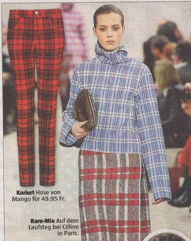
Kariert Hose von Mango für 49.95 Fr.