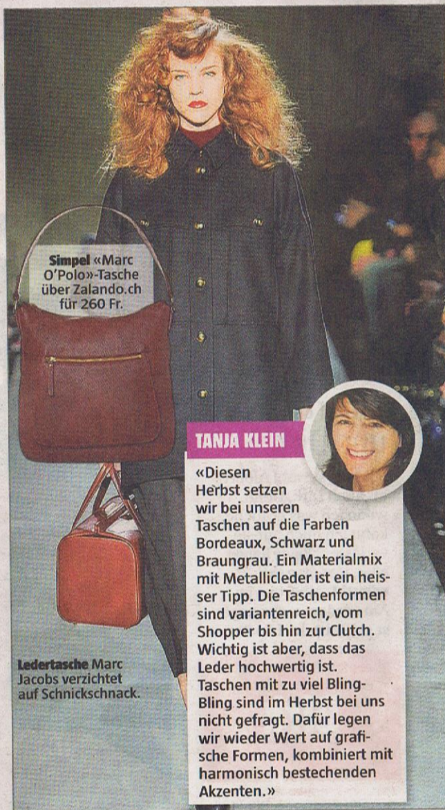
Simpel «Marc O'Polo»-Tasche über Zalando.ch für 260 Fr.